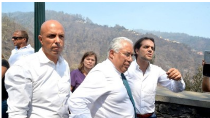
Protagonismo nos incêndios regressa ao parlamento